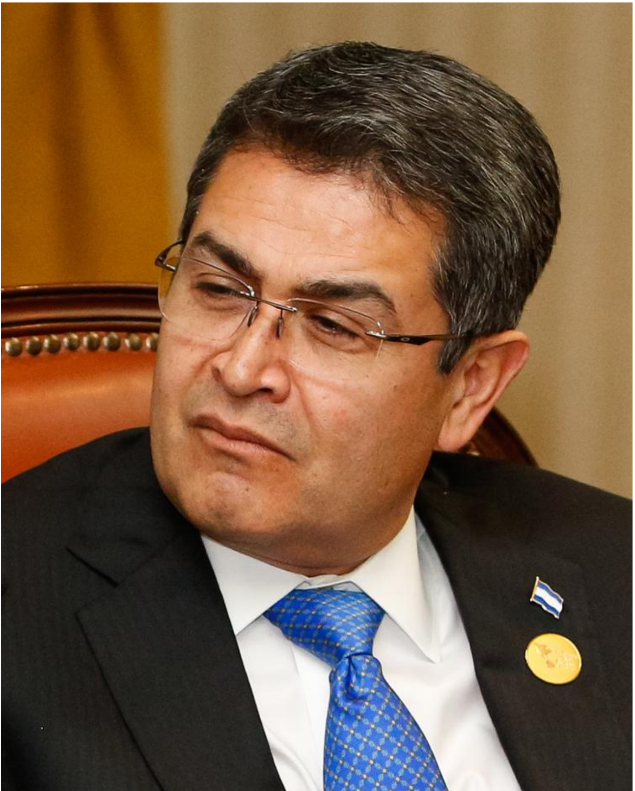
Präsident von Honduras, Juan Orlando Hernández