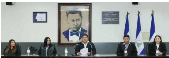
Der Vorsitzende des Berufungsgerichts des Bezirks Managua gibt am 15. Februar die Urteile gegen 94 Angeklagte bekannt, die zu Landesverrättern erklärt werden.

Die Repression ging unvermindert weiter, dabei setzte die Regierung auf ein neues Mittel: Ausbürgerungen.