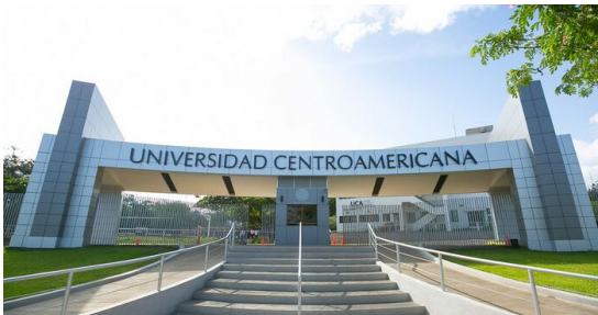
Universidad Centroamericana (UCA) in Managua.

Die Repression gegen Institutionen und Personen der Kirche hielt das ganze Jahr über an. Die Osterprozessionen wurden verboten und kirchliche Organisationen verloren ihren Rechtsstatus und wurden enteignet. Dies traf unter anderen Caritas Nicaragua, die Jesuiten und die Franziskaner.