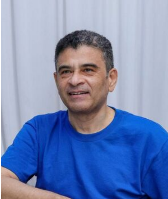
Rolando Álvarez, Bischof von Matagalpa, wegen „Verschwörung“ zu 26 Jahren Gefängnis verurteilt.

Hauptziel der politischen Verfolgung war 2023 eindeutig die katholische Kirche. Da wiederum stand die Person des Bischofs von Matagalpa, Rolando Álvarez, im Zentrum. Von der Regierung Ortega war geplant, dass Rolando Álvarez, der seit August 2022 unter Hausarrest stand, am 9. Februar auch ausgewiesen werden sollte. Álvarez weigerte sich aber Nicaragua zu verlassen, ohne vorher diese Entscheidung mit der Bischofskonferenz besprechen zu können. Daniel Ortega hat ihm das offensichtlich sehr übelgenommen und sich über den Ungehorsam des Bischofs beklagt und ihn ausgiebig als Terroristen beschimpft. (8) Einen Tag nach der Weigerung des Bischofs, Nicaragua zu verlassen, wurde Rolando Álvarez wegen „Verschwörung“ zu 26 Jahren und vier Monaten Gefängnis verurteilt. (9)