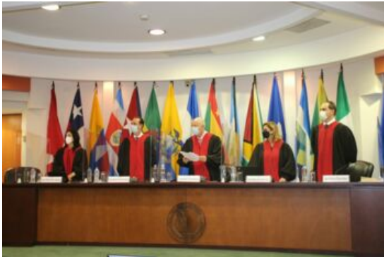
Tagung des Interamerikanischen Gerichtshofs für Menschenrechte (CIDH).

Auf internationaler Ebene gab es eine Vielzahl von Versuchen, auf die Regierung Nicaraguas einzuwirken. Die USA und die EU haben ihre Sanktionen verlängert beziehungsweise erweitert. Die Interamerikanische Kommission für Menschenrechte (CIDH), der Interamerikanische Gerichtshof für Menschenrechte (Corte IDH) und das Hohe Kommissariat für Menschenrechte der UNO befassten sich mehrfach mit der Situation der Menschenrechte in Nicaragua. Die Regierung Ortega - Murillo verweigerte aber jegliche Zusammenarbeit. Stattdessen beschleunigte Nicaragua seinen Austritt aus der OAS und wies deren Vertretung aus. (9) Die Nicaraguaner*innen selbst wurden theoretisch auch befragt, denn 2022 fanden Kommunalwahlen statt. Die Wahl fand ohne eine echte Opposition statt und war intransparent wie immer. So war es kaum noch überraschend, dass der Oberste Wahlrat alle Bürgermeisterämter der FSLN zusprach, ein weiterer Schritt des Landes auf dem Weg zur Einheitspartei. Das Interessanteste an der Wahl war die offizielle Zahl der Wahlberechtigten. Die war überraschenderweise um 750.000 geringer als bei der Nationalwahl im Jahr zuvor. (10) Eine offizielle Erklärung dafür gab es nicht,