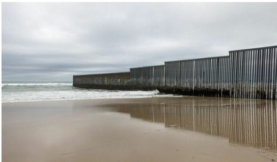
Grenzmauer zwischen Mexiko und den USA in Tijuana, Mexiko.

Aber vielleicht hängt es einfach damit zusammen, dass die Zahl der Emigrant*innen im Jahr 2022 dramatisch angestiegen ist. Zwar gibt es dazu keine direkten Zahlen, aber eine Menge von Fakten, die diesen enormen Anstieg belegen. Vor allem nahm die Emigration in die USA wie schon 2021 im Jahr 2022 noch einmal stark zu. Dies zeigt deutlich die Zahl der Abschiebungen, die die Zoll- und Grenzschutzbehörde der Vereinigten Staaten von Amerika (CBP) monatlich veröffentlicht. (11) Demnach wurden 2022 insgesamt 164.600 Nicaraguaner*innen beim Versuch, unerlaubt die Grenze der USA zu passieren, abgeschoben. Dies waren mehr als dreimal so viele wie im Jahr zuvor (50.722). Im Jahr 2020 waren es noch weit weniger als 10.000 gewesen.