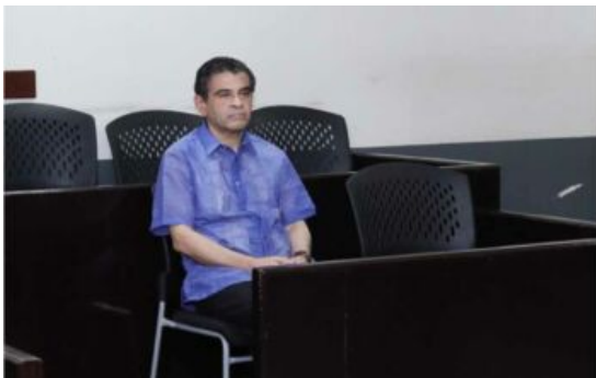
Bischof Rolando Álvarez bei der Anklageerhebung wegen „Verschwörung zur Untergrabung der nationalen Integrität“, Quelle: Poder Judicial, Dirección General de Comunicaciones

Auffällig war die Zunahme der Repression gegen Institutionen und Mitglieder der Katholischen Kirche. Es begann im März mit der Ausweisung des katholischen Nuntius Waldemar Sommertag, setzte sich fort mit der Schließung einiger kirchlicher Radiosender und gipfelte im August in der Festnahme des Bischofs von Matagalpa, Rolando Álvarez. Im Dezember wurde auch gegen ihn Anklage wegen „Verschwörung zur Untergrabung der nationalen Integrität“ erhoben. (7)