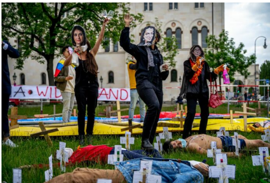
Performance bei einer Kundgebung in München gegen Polizei- und Staatsgewalt in Kolumbien. Unterstützung der Protesten im Land.

Einer der Hauptgründe für den landesweiten Streik und die Proteste im Land, war eine Steuerreform. Sie wurde unter dem Namen Sozialinvestitionsgesetz verabschiedet, aber im Senat nicht ordnungsgemäß erörtert (38) . Zur Vervollständigung dieses Bildes sei noch auf die Korruptionsfälle im Justizbereich hingewiesen. Im März 2021 wurde ein ehemaliger Präsident des Obersten Gerichtshofs zu 19 Jahren Haft verurteilt.