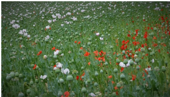
Schlafmohnanbau im Süden Kolumbiens

Anfang 2021 versuchte die kolumbianische Regierung, das Sprühen von Glyphosat aus der Luft auf Koka-Pflanzen wieder zu legalisieren. Das Verfassungsgericht beanstandete aber die Entscheidung der Regierung mit der Begründung, dass die Grundrechte der betroffenen Gemeinschaften geschützt werden müssen (31) . Indigene Gemeinschaften wären wieder einmal am stärksten betroffen, nicht nur wegen der Gesundheits- und Umweltprobleme, sondern auch wegen der kulturellen Auswirkungen. Einige indigene Gemeinschaften verwenden Kokablätter für medizinische Zwecke, für Zeremonien oder zur Herstellung legaler Produkte.