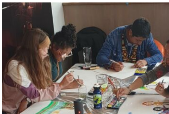
Psychosozialer Workshop zur Unterstützung unseres ESI-Gastes. Gemeinsam sind wir stärker!

Dieses Stipendienprogramm für Menschenrechtsverteidiger*innen, das vom Institut für Auslandsbeziehungen mit Mitteln des Auswärtigen Amtes gefördert wird, ermöglichte es uns, einen Verteidiger indigener Rechte nach München einzuladen. Die Verwaltung seiner Gemeinde wurde im Jahr 2020 von Personen übernommen, die mit Drogenhändlern in Verbindung stehen und den Schlafmohn in der Gemeinde wieder anpflanzen wollten. Wer sich dem entgegen setzte, musste mit hohen Strafen rechnen oder die Gemeinde verlassen. Das war der Fall unseres Gastes, der zuerst entführt und danach verfolgt und kriminalisiert wurde.