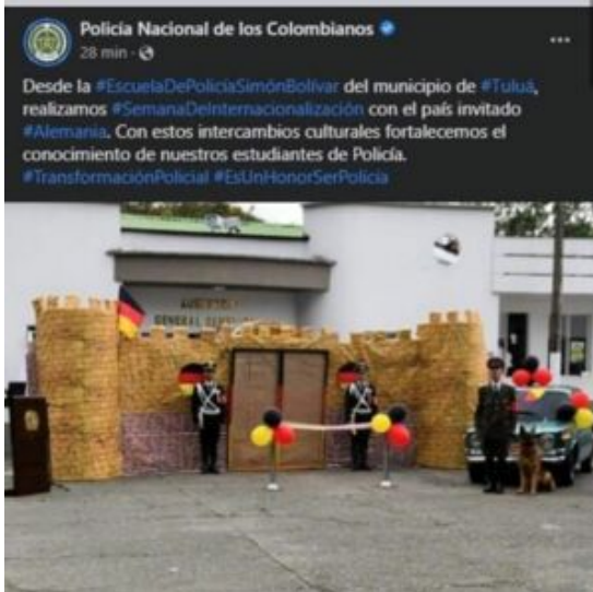
Nazi-Darstellung bei einem offiziellen Polizeifeier. Der Tweet wurde gelöscht.

Internationale Skandale, in die Kolumbien verwickelt war, waren die Ermordung des Präsidenten von Haiti durch eine Gruppe ehemaliger Soldaten der kolumbianischen Armee im Juli 2021 (40) , und die Feierlichkeiten zur Internationalisierungswoche einer Polizeischule. Bei dieser Feier wurden Darstellungen verwendet, die auf Nazi-Deutschland anspielten und einige Polizisten trugen Gestapo-Kostüme. Das diplomatische Korps Israels und Deutschlands verurteilten diese Verehrung des Nationalsozialismus (41) .