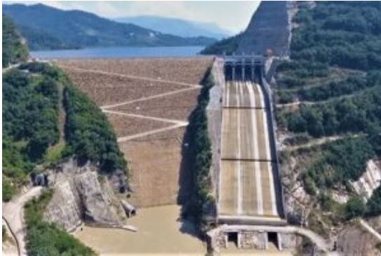
Megastaudamm Hidroituango, der wegen seiner sozialen und ökologischen Auswirkungen ebenfalls stark kritisiert wird.

Seit mehreren Jahren beobachten wir die Probleme dieses Megastaudamms, der in der Gemeinde Ituango zu sozio-ökologischen Katastrophen geführt hat. Im Laufe des Jahres 2021 wurden u.a. ehemalige Manager von Empresas Públicas de Medellín, die für das Projekt verantwortlich waren, und ehemalige Gouverneure des Regierungsbezirks Antioquia wegen finanzieller und baulicher Fehler angeklagt. Die Versicherer erklärten sich bereit, einen Teil des Schadens zu übernehmen (45) . Ein Gutachten der Firma Pöyry zeigt deutlich, dass ein hohes Risiko für einen katastrophalen Dammbbruch besteht. Trotzdem schließt der Bericht mit der Empfehlung, den Damm sofort wieder in Betrieb zu nehmen. Die Bewegung Rios Vivos wies den Bericht des Unternehmens als parteiisch und als Teil der Strategie zur Fortführung des Hidroituango-Geschäfts zurück (46) .