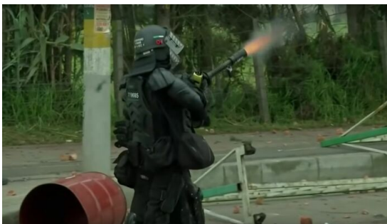
Polizei- und Staatsrepression als Reaktion auf Proteste in Kolumbien

"Wenn ein Volk mitten in einer Pandemie auf die Straße geht, um zu protestieren, dann deshalb, weil die Regierung gefährlicher ist als das Virus". Dieser Satz wurde im Rahmen des landesweiten Streiks und der Proteste ab dem 28. April 2021 sehr populär. Der Streik war ursprünglich als Protest gegen eine Steuerreform und anderer Punkte, die bereits in diesem Bericht erwähnt wurden, ausgerufen worden. Dies war der größte soziale Protest seit den 1940er Jahren mit Demonstrationen im ganzen Land. Auch in Deutschland, Österreich, Spanien, Frankreich, Belgien und England fanden Proteste statt. Die Mobilisierung brachten nicht nur die Unzufriedenheit der Gesellschaft zum Ausdruck, sondern auch die Abnutzung des repressiven politischen Modells, das in dem Land seit seiner Unabhängigkeit im Jahr 1810 existierte. Mit der Steuerreform hätte das Haushaltsdefizit des Staates gelöst werden sollen, indem die Steuerlast für Bürger*innen mit geringem Einkommen erhöht und gleichzeitig Einzelpersonen und Unternehmensgruppen mit großem Kapital entlastet werden sollten.