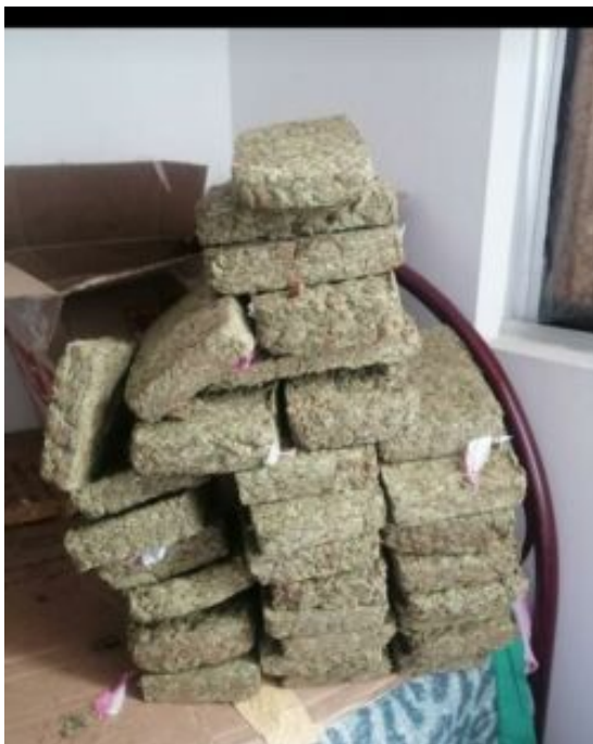
Weiche und harte Drogen werden in großen oder kleinen Mengen über Chatgruppen verkauft, ebenso wie Waffen oder sogar Sex.

Seit 2018 ist ein leichter, aber stetiger Rückgang der mit Kokasträuchern bepflanzten Fläche zu verzeichnen, die im Jahr 2020 bei 143.000 Hektar lag. Die Kokainproduktion nahm jedoch aufgrund der Technifizierung des Produktionsprozesses zu (27) . Einerseits kehrten 2015 und 2016 Hunderte von Landwirten zum Kokaanbau zurück, weil sie auf die im Rahmen des Abkommens angebotenen Vorteile hofften. Doch die vereinbarten Programme funktionierten nicht oder nur halbherzig. Andererseits strukturierte die internationale Mafia ihre Aktivitäten in Kolumbien um und investierte in die Sicherheit und die Verbesserung der Produktion (28) .