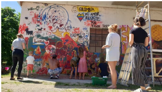
"Colombia mi amor Resiste por favor". Wandbild, das während des Festivals Fette de la Musique gemalt wurde, wo wir über die Situation in Kolumbien berichteten.

In vier Reden gelang es uns, die dringende Botschaft über die Lage in Kolumbien an mehr als 420 Personen zu übermitteln. Diese Reden wurden bei verschiedenen Terminen mit Mitarbeiter*innen des Auswärtiges Amtes, der ehemaligen deutschen Menschenrechtsbeauftragten und anderen Teilnehmern des ESI-Programms gehalten. Weitere Redebeiträge hatten bei verschiedenen Aktionen auf öffentlichen Plätzen. Zum Beispiel auf dem Festival Fette de la Musique berichteten unser ESI-Gast und unser Referent vor mehr als 300 Personen ausführlich über die Lage in Kolumbien. Der Stipendiat wurde auch für Radiosendungen, Podcasts und Zeitschriften interviewt.