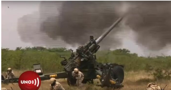
Militärische Übungen mit schwerer Artillerie an der venezolanischen Grenze. Die kolumbianische Regierung präsentierte ihr militärisches Arsenal an dieser Grenze und in den Städten. Provokation?

Zugleich wächst aber die Ablehnung des Uribismus. Die Kandidaten der Mitte und des rechten Lagers versuchen, sich vom ehemaligen Präsidenten Álvaro Uribe Vélez, dem Vorsitzenden der Regierungspartei, zu distanzieren. Der Kandidat für die Wahlen 2022 seiner rechtsextremen Partei Centro Democrático erreicht nur sehr geringe Zustimmungswerte, so dass die Uribistas Bündnisse mit anderen Parteien suchten. Es ist auch erwähnenswert, dass dies die zweite und letzte Legislaturperiode ist, in der die politische Partei COMUNES 10 Sitze im Parlament sicher erhält.