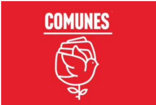
Neues Logo der neu benannten Partei COMUNES

Wir konnten uns mit einem Verteidiger indigener Rechte solidarisieren, der einen Raum zum Ausruhen und Lernen erhielt, um seine persönlichen und gemeinschaftlichen Pläne voranzutreiben. Vor allem aber konnte er das Risiko von Angriffen auf sich und sein Team verringern. Wir haben unser Gast noch geholfen, ein zusätzliches Stipendium zu erhalten, um die Verteidigung und Stärkung seiner Gemeinschaft fortzusetzen. Darüber hinaus konnten wir uns auch mit anderen Menschen solidarisieren und sie bei der Suche nach Verringerung ihrer Sicherheitsrisiken unterstützen. #