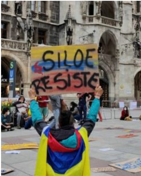
„Siloe widersteht“ – Noch eine Kundgebung in München gegen das Verschwindenlassen hunderter Menschen während der Proteste in Kolumbien, Quelle: La pulga/Nana

Massaker und gezielte Ermordungen: Die Mordrate war im Jahr 2021 die höchste seit 2014. Indepaz dokumentierte im vergangenen Jahr 96 Massaker (13) . Führende Persönlichkeiten aus dem sozialen und ökologischen Bereich in verschiedenen Gebieten des Landes wurden angegriffen. 338 dieser Personen wurden getötet.