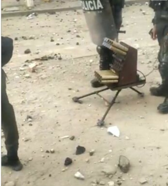
Die Polizei setzte auch unkonventionelle Waffen ein, um Proteste im Lande zu unterdrücken.

Das Erwachen der Bevölkerung wies die wirtschaftlichen und politischen Eliten in ihre Schranken. Gegenüber der sozialen Mobilisierung reagierte die kolumbianische Regierung mit der Kriminalisierung der Personen und Organisationen, die die Proteste organisierten, und verfolgte die Doktrin der "demokratischen Sicherheit", was zu einer systematischen Verletzung der Grundrechte der Demonstrant*innen führte (49) . Diese Menschenrechtsverletzungen wurden von verschiedenen Organisationen wie dem UN-Menschenrechtsbüro in Kolumbien und Human Rights Watch dokumentiert, die von 63 bzw. 68 im Zusammenhang mit den Protesten getöteten Menschen berichteten. Ihren Berichten zufolge waren 76 % davon auf Schussverletzungen zurückzuführen (50) . INDEPAZ berichtete seinerseits von 80 Toten, 4.687 Fällen von Polizeigewalt, dem Einsatz nicht-konventioneller Waffen durch die Polizei, 2.005 willkürlichen Verhaftungen und 28 Opfern sexueller Gewalt durch die Sicherheitskräfte (51) . Auch die CIDH, internationale Kommissionen und europäische Diplomaten legten Berichte vor und bestätigten Rechtsverletzungen durch die Polizei und den Staat. Die kolumbianische Regierung wies diese Berichte zurück und begab sich auf eine diplomatische Reise durch Europa, um ihre Reaktion auf die Proteste zu rechtfertigen und Menschenrechtsverletzungen zu leugnen (52) .