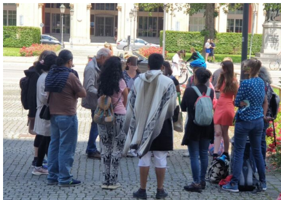
Rundgang in München mit anderen ESI-Stipendiaten und Freunden vom Arbeitskreis Kolumbien und Aluna Minga e.V. Thema: (De-)Kolonialismus

Ohne die Zusammenarbeit mit vielen Menschen und Organisationen wäre das nicht möglich gewesen. Wir möchten die Zusammenarbeit mit ihnen würdigen und uns bei ihnen bedanken. Unser Dank gilt vor allem dem Team und den Freiwilligen vom Öku-Büro, dem AK-Kolumbien zusammen mit Aluna Minga, dem Team von Klimasolidarität, dem Team des ESI-Projektes und unseren Praktikanten im Jahr 2021. Und wir bedanken uns bei den Organisationen und Kollektiven mit denen wir Aktivitäten oder Veröffentlichungen teilten: die Organisationen der MRKK, Columba-Netzwerk, und alle weitere Organisationen mit denen wir zusammen gearbeitet haben, in München besonders das Kulturreferat, der Migrationsbeirat, MORGEN e.V. und der Münchner Flüchtlingsrat. In Kolumbien: die Pastoral Social, das Programm Somos Defensores, und andere Kollektiven.