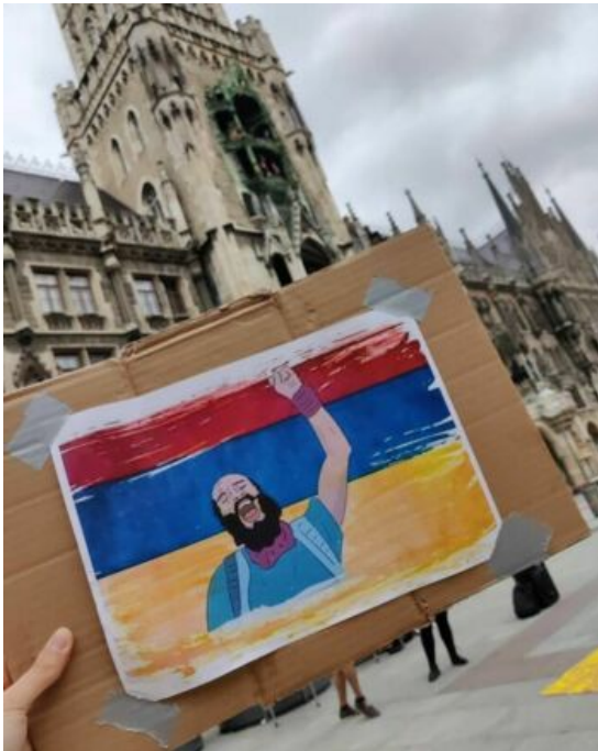
Author: Aluna Minga e.V.

Wir konnten uns mit einem Verteidiger indigener Rechte solidarisieren, der einen Raum zum Ausruhen und Lernen erhielt, um seine persönlichen und gemeinschaftlichen Pläne voranzutreiben. Vor allem aber konnte er das Risiko von Angriffen auf sich und sein Team verringern. Wir haben unser Gast noch geholfen, ein zusätzliches Stipendium zu erhalten, um die Verteidigung und Stärkung seiner Gemeinschaft fortzusetzen. Darüber hinaus konnten wir uns auch mit anderen Menschen solidarisieren und sie bei der Suche nach Verringerung ihrer Sicherheitsrisiken unterstützen.