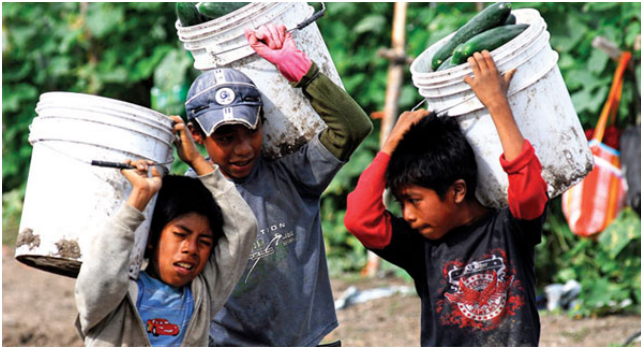
Arbeitende Kinder aus Guerrero als Tagelöhner in der Landwirtschaft im Norden von Mexiko

Die Region Montaña im Bundesstaat Guerrero zum Beispiel ist eine der ärmsten in Mexiko. Die Bevölkerung - mehrheitlich Indigene - kann nicht vom saisonalen Anbau von Mais und Bohnen leben. Ganze Familien fahren in die großen Agrarregionen in den nördlichen Bundesstaaten, wie Sinaloa oder Sonora, und lassen sich als landwirtschaftliche Tagelöhner_innen anheuern. Die Arbeitsbedingungen sind miserabel, Rechte werden nicht respektiert. Seit Jahren unterstützen unsere Partner_innen vom Centro Tlachinollan die Arbeit des Rates der landwirtschaftlichen Tagelöhner_innen (Consejo de Jornaleros Agrícolas de la Montaña), beraten sie in Rechtsangelegenheiten und setzen sich dafür ein, diese vergessene Migration bekannt zu machen. Wir haben beschlossen, diese Situation hierzulande zu thematisieren. Für nächstes Jahr planen wir eine Rundreise mit einem Angehörigen des Rates der Tagelöhner_innen und einem Mitglied von Tlachinollan.