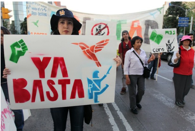
Dokumentation unerwünscht: Menschenrechtsverteidiger_innen demonstrieren gegen Übergriffe und werden selbst angegriffen.

Diese Situation stellt ein Novum dar und zeugt von einer Verschärfung der Repression in Mexiko. Denn die Übergriffe sind keine Einzelfälle, sondern Teil einer Strategie der Regierung. Laut einem Bericht der Zeitschrift Proceso wird im aktuellen Konzept der Polizer von Mexiko-Stadt sogar der Einsatz von Feuerwaffen bei Demonstrationen diskutiert. 2