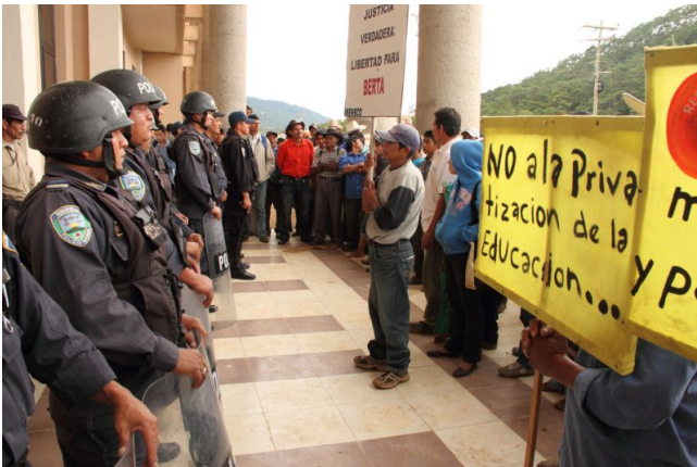
Polizei und Justiz auf der selben Seite: Protest von COPINH vor dem Justizpalast von Esperanza