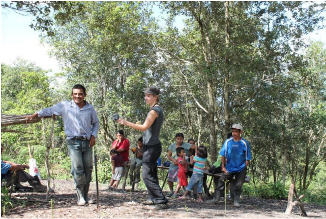
Die Bewohner_innen von Rio Blanco berichten von einem Überfall der Polizei auf ihre Gemeinde

Im westlichen Hochland von Honduras sind 47 Konzessionen für Flussprivatisierungen und Wasserkraftwerke bekannt. 46 der Projekte werden von der lokalen indigenen Bevölkerung vehement abgelehnt. Zum Präzedenzfall und Symbol des Kampfes der Lenca-Gemeinden für ihre Rechte hat sich in diesem Jahr das Staudammprojekt „Agua Zarca“ in der Region Rio Blanco entwickelt. Am Rio Gualcarque wollte die honduranische Gesellschaft DESA gemeinsam mit der chinesischen SINOHIDRO im Frühjahr 2013 mit den Bauarbeiten beginnen. Die betroffenen Gemeinden hatten den Bau in Gemeindeversammlungen klar abgelehnt. Sie berufen sich darauf, dass der honduranische Staat ihre in der ILO-Konvention 169 zum Schutz indigener Ethnien garantierten Rechte zu respektieren hat. Nachdem dies nicht der Fall war, begannen Bewohner_innen der betroffenen Gemeinden mit Unterstützung des Zivilen Rates der Volks- und indigenen Organisationen von Honduras (COPINH) am 1. April die Zufahrtsstraße zum Baugelände zu blockieren. Die Betreibergesellschaft DESA reagierte mit der üblichen Doppelstrategie: dem Versuch, die Gemeinden und ihre Organisation zu spalten und mit Repression gegen diejenigen, die sich weder kaufen, noch einschüchtern ließen. Militär und Polizei wurden auf dem Baugelände stationiert.