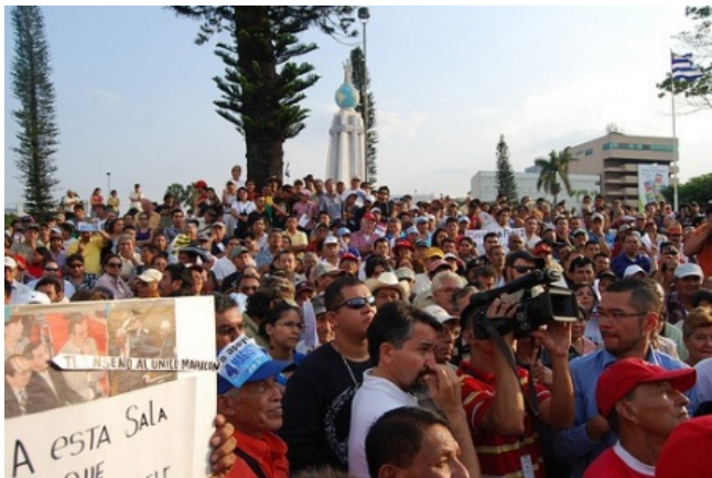
Massendemonstrationen gegen das Dekret 743 in San Salvador