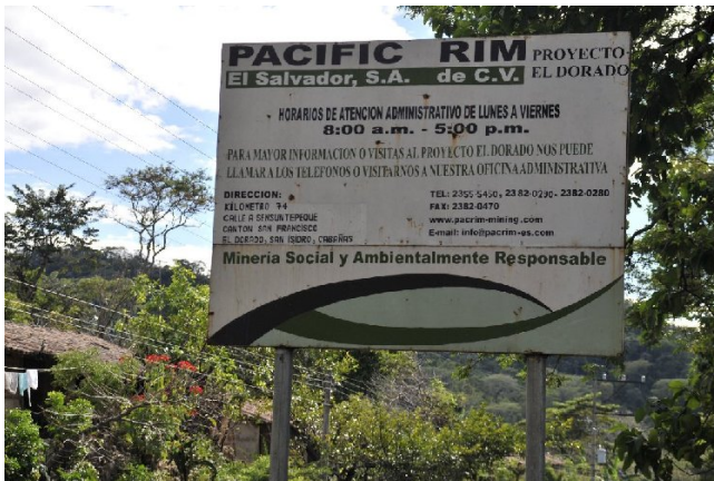
Die kanadische Firma Pacific Rim bewirbt ihren "sozial- und umweltverträglichen" Bergbau

Einen Erfolg konnten die BergbauegnerInnen in El Salvador hingegen im März feiern, als die Klage des US-amerikanischen Unternehmens Commerce Group gegen den salvadorianischen Staat vor dem – an der Weltbank angesiedelten – Internationalen Schiedsgericht ICSID (International Centre for the Settlement of Investment Disputes) abgelehnt wurde. Das Unternehmen hatte den Staat El Salvador wegen „entgangener Gewinne“ auf 100 Mio. US-$ verklagt, die ihm durch den 2009 durch die Regierung erlassenen Bergbau-Stopp entgangen waren. Dass die Klage abgelehnt wurde, war jedoch keine politische Entscheidung gegen den Goldbergbau in Zentralamerika, dem Unternehmen Commerce Group wurden lediglich Verfahrensfehler angelastet. Eine vergleichbare Klage des kanadischen Unternehmens Pacific Rim gegen El Salvador bei dem Weltbank-Tribunal ICSID wegen „entgangener Profite“ über 70 Mio. US-$ ist jedoch noch nicht beschieden. Ermöglicht werden diese Klagen durch die Investitionsschutzbestimmungen des Zentralamerikanischen Freihandelsabkommens CAFTA-DR. Die klagenden Firmen sehen keine gesetzliche Basis für eine Nichtgewährung der Abbaugenehmigung.