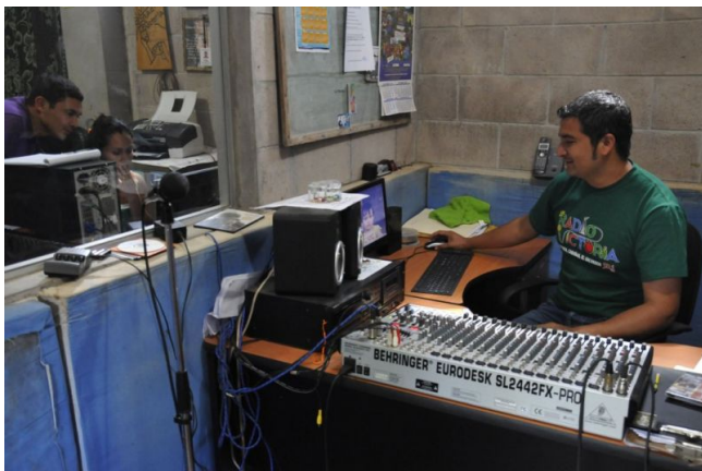
In den Produktionsräumen von Radio Victoria