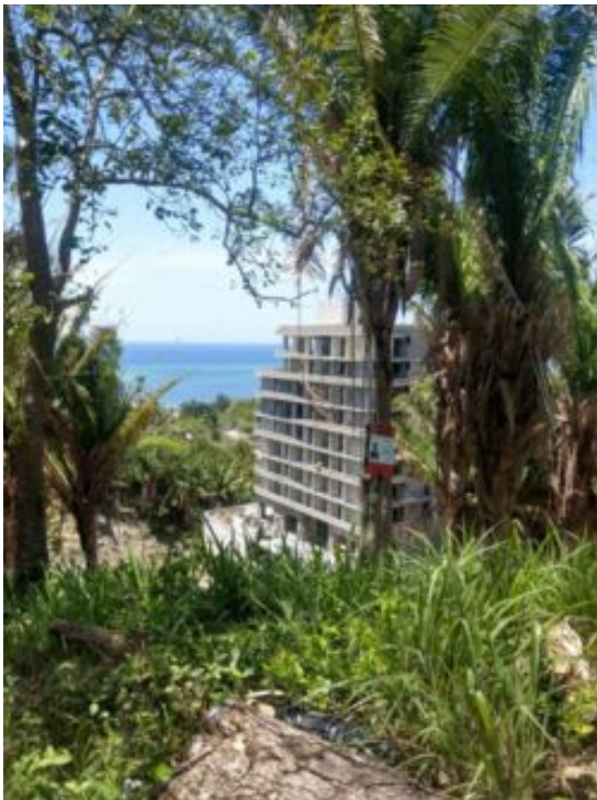
Obras de construcción del complejo de hasta 14 plantas "Duna Resorts" en la localidad privada de Próspera, en Roatán.

Las ZEDEs se consideraban el proyecto favorito del autocrático ex-presidente hondureño Juan Orlando Hernández, actualmente procesado en Estados Unidos por conspiración y narcotráfico a gran escala. Una amplia alianza de la sociedad civil protestó contra el proyecto durante años. Tras la toma de posesión del gobierno democráticamente elegido de Xiomara Castro, la Ley ZEDE fue derogada en 2022. Sin embargo, la anulación de la enmienda constitucional sigue pendiente. El Grupo de Empresas Próspera sigue construyendo en Roatán a pesar de la derogación de la Ley ZEDE y presentó una demanda por más de 10.000 millones de dólares contra el Estado hondureño ante un tribunal de arbitraje del Banco Mundial. La ciudad privada está siendo promovida por empresarios estadounidenses, pero también alemanes.