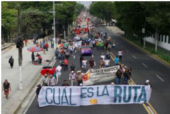
Wohin geht der Weg? Demonstration sozialer Bewegungen gegen die Repression in El Salvador am 1. Mai 2023.

Auf den ersten Blick waren die Ergebnisse der Wahlen am 4. Februar 2024 in El Salvador wenig überraschend: Während sich Präsident Nayib Bukele verfassungswidrig für eine zweite Amtszeit wählen ließ, holte seine Partei Nuevas Ideas bei den Parlamentswahlen die große Mehrheit der Abgeordnetensitze. Auch bei den Kommunalwahlen im März lag Nuevas Ideas vorne. Bei einer genaueren Analyse zeigen die Wahlergebnisse, dass Nayib Bukele den Zenith seiner Popularität überschritten hat. So hat der Rechtspopulist zwar nach offiziellen Angaben 84 Prozent der gültigen Stimmen erhalten, doch hatte er als Wahlziel 90 Prozent ausgegeben. Zudem wurden zahlreiche Manipulationen bekannt, ohne die Bukele und vor allem Nuevas Ideas deutlich weniger Stimmen bekommen hätten. Es wurden Dutzende Fälle bekannt, in denen die Wahlergebnisse zugunsten des Präsidenten und seiner Partei verändert wurden.