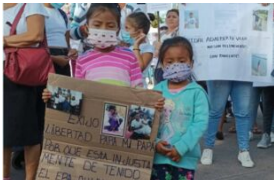
El Salvador im Ausnahmezustand 2022.

Angehörige von willkürlich Verhafteten fordern deren Freilassung.