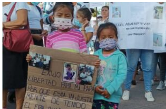
El Salvador im Ausnahmezustand 2022. Angehörige von willkürlich Verhafteten fordern deren Freilassung.