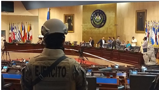
Auf Befehl des Präsidenten besetzen am 9. Februar Soldaten das Parlament in San Salvador, Quelle: IPUPresident

Seit den Parlamentswahlen Anfang dieses Jahres regiert der amtierende Präsident El Salvadors Nayib Bukele von der Partei Nuevas Ideas mit einer komfortablen 2/3 Mehrheit. Seitdem arbeitet er eifrig an der Demontage der ohnehin fragilen demokratischen Institutionen des Landes. Beispiele seines Autoritarismus sind die verfassungswidrige Neubesetzung des Obersten Gerichtshofs, die Militarisierung des Landes im Zuge der Corona-Pandemie sowie die Ankündigung, die Größe der Armee innerhalb der nächsten fünf Jahre zu verdoppeln. Vor kurzem ermöglichten die von Bukele eingesetzten Verfassungsrichter die erneute Kandidatur des amtierenden Präsidenten.