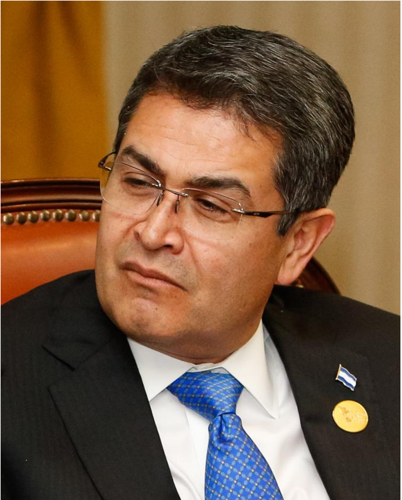
Präsident von Honduras, Juan Orlando Hernández